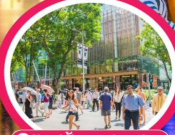
ช้อปปิ้งออร์ชาร์ด