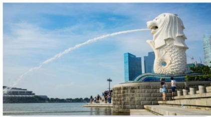
เมอร์ไลออน