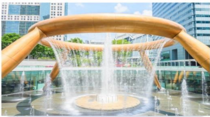
น้ำพุแห่งโชคกลาง