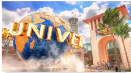
ยูนิเวอร์แซล สตูดิโอ