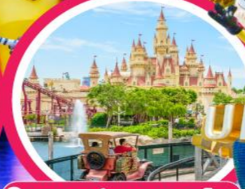
ยูนิเวอร์แซล สตูดิโอ