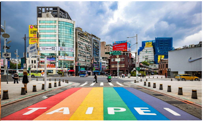
พักที่ TAIPEI HOTEL หรือเทียบเท่า ระดับ 4 ดาว , กรุงไทเป

วันที่ 4 กรุงไทเป - วัดหลงซาน - ร้านสร้อยเจอร์เมเนียม - ตลาดปลาไทเป - อนุสรณ์สถานเจียงไคเช็ค - ตึกไทเป 101 - สนามบินเถาหยวน (ไต้หวัน) - สนามบินสุวรรณภูมิ (กรุงเทพฯ)