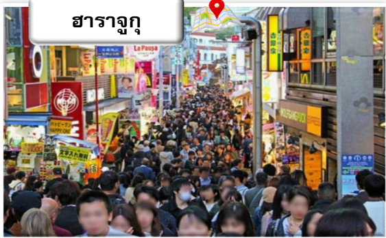
ฮาราจูกุ

ฮาราจูกุ ย่านขายของกินของใช้และสถานที่เที่ยวของบรรดา วัยรุ่นวัยทีน โดยเฉพาะช่วงสุดสัปดาห์นั้นละแวกบริเวณ ทาเคชิตะโดริ ถนนสายแคบระหว่าง สถานีฮาราจูกุ กับถนน เมจิโดริ เรียกว่าแทบไม่มีที่หายใจ ถ้ามีเวลา ขอแนะนำท่านให้เข้าไปชม ศาลเจ้าเมจิ