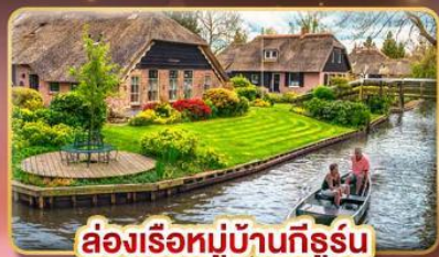
ล่องเรือหมู่บ้านที่รูร์น