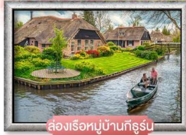
ล่องเรือหมู่บ้านทีร์รู่น