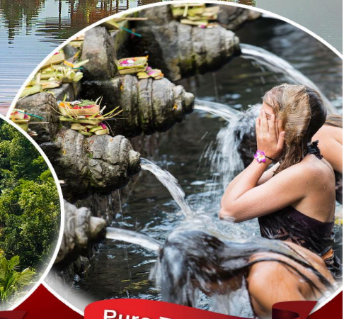
Pura Tirta Empul

มนต์เสน่ห์ เกาะบาหลี วิหารทานาคาลอต บ่อน้ำพุศักดิ์สิทธิ์ Pura Tirta Empul หมู่บ้านคินตามณี ภูเขาไฟ, ทะเลสาบ บาตุร์