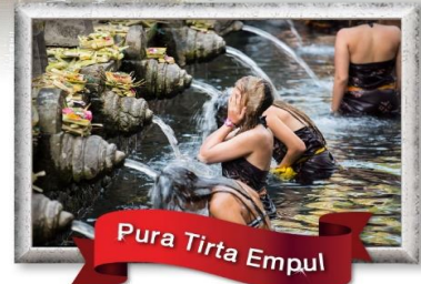
Pura Tirta Empul