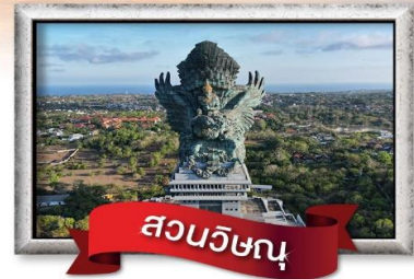
สวนวีชณู