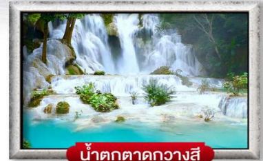
น้ำตกตาดกวางสี