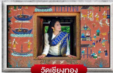
วังเชียงทอง