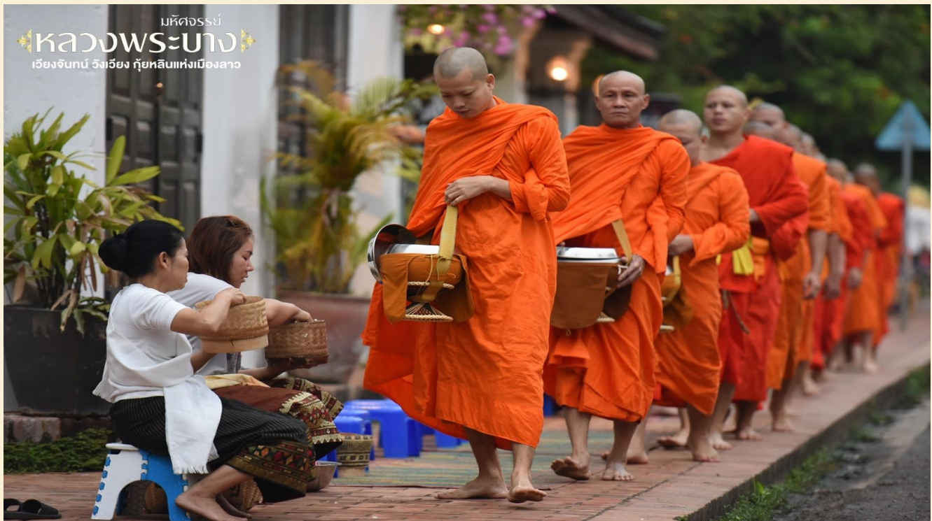
มหัศจรรย์ หลวงพระบาง เวียงจันทน์ ฝั่งเวียง กุ้ยหลินแห่งเมืองลาว