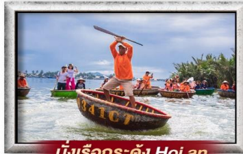
นั่งเรือกระดัง Hoi an