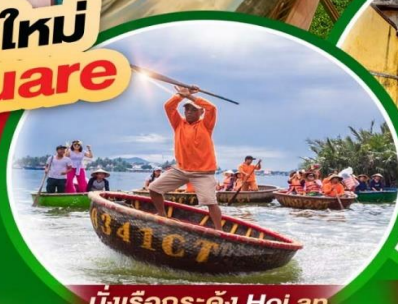
นั่งเรือกระดิง Hoi an