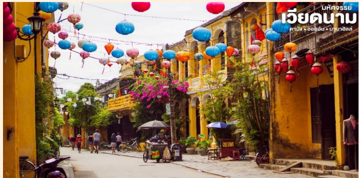
บหัทจรรษย์ เวียดนาม ดานัง • ฮอยอัน • ฮานอย

📍 นำท่านเดินทางสู่ “เมืองโบราณฮอยอัน” เมืองฮอยอันนั้นอดีตเคยเป็นเมืองท่า การค้าที่สำคัญแห่งหนึ่งในเอเชียตะวันออกเฉียงใต้และเป็นศูนย์กลางของการ แลกเปลี่ยนวัฒนธรรมระหว่างตะวันตกกับตะวันออกองค์การยูเนสโกได้ประกาศให้ฮอยอันเป็นเมืองมรดกโลกทางวัฒนธรรมเนื่องจากเป็นสถานที่สำคัญทางประวัติศาสตร์ แม้ว่าจะผ่านการบูรณะขึ้นเรื่อยๆแต่ก็ยังคงรูปแบบของเมืองฮอยอันไว้