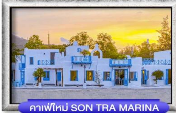
คาเฟ่ใหม่ SON TRA MARINA