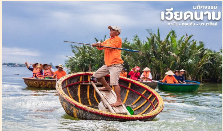
บหัทจรรษย์ เวียดนาม ดานัง • ฮอยอัน • ฮานอย

เมืองฮอยอันตั้งอยู่ในสวนมะพร้าวริมแม่น้ำ ระหว่างการล่องเรือท่านจะได้ชมวัฒนธรรมอันสวยงาม ชาวบ้านจะขับร้องเพลงพื้นเมือง ผู้ชายกับผู้หญิงจะหยอกล้อกันไปมาหน้าที่พายเรือมาเคาะกันเป็นจังหวะดนตรีสุดสนุกสนาน