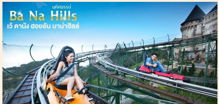
มหัศจรรย์ Ba Na Hills เว้ ดานัง ฮอยอัน บานาฮิลล์

📍 จุดที่สร้างความตื่นเต้นให้นักท่องเที่ยวชมองดูอย่างอลังการที่ซึ่งเต็มไปด้วยเสน่ห์แห่งตำนานและจินตนาการของการผจญภัยที่ สวนสนุก The Fantasy Park (รวมค่าเครื่องเล่นบนสวนสนุก ยกเว้น หุ่นซีดีังที่ไม่รวมให้ในรายการ) ที่เป็นส่วนหนึ่งของบานาฮิลล์ท่านจะได้พบกับเครื่องเล่นในหลายรูปแบบเช่นท้าทายความมันส์ของหนัง 4D, ระทึกขวัญกับบ้านผีสิงและอื่นๆเกมส์สนุกๆเครื่องเล่นเบาๆรถไฟเหาะแมงมุมเวียนหัว ตลอดไปจนถึงระทึกขวัญสั้น