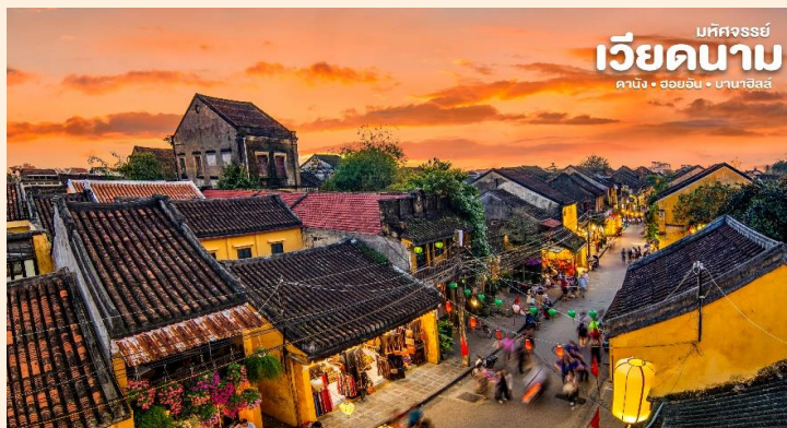
บหัทจรรษย์ เวียดนาม ดานัง • ฮอยอัน • ฮานอย

📍 นำท่านเดินทางสู่ “เมืองโบราณฮอยอัน” เมืองฮอยอันนั้นอดีตเคยเป็นเมืองท่า การค้าที่สำคัญแห่งหนึ่งในเอเชียตะวันออกเฉียงใต้และเป็นศูนย์กลางของการ แลกเปลี่ยนวัฒนธรรมระหว่างตะวันตกกับตะวันออกองค์การยูเนสโกได้ประกาศให้ฮอยอันเป็นเมืองมรดกโลกทางวัฒนธรรมเนื่องจากเป็นสถานที่สำคัญทางประวัติศาสตร์ แม้ว่าจะผ่านการบูรณะขึ้นเรื่อยๆแต่ก็ยังคงรูปแบบของเมืองฮอยอันไว้