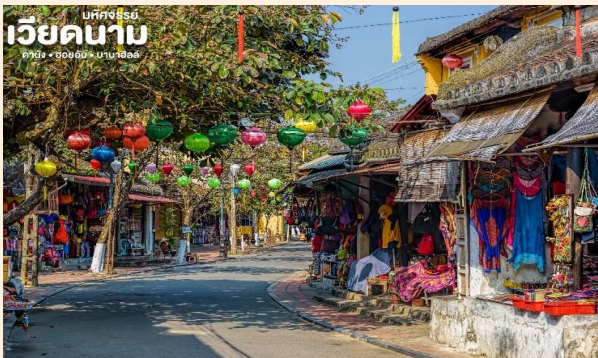
บหัทจรรษย์ เวียดนาม ดานัง • ฮอยอัน • ฮานอย

(ไม่รวมค่าทิปคนพายเรือ ท่านละ 40 บาท/ต่อท่าน/ต่อทริป)