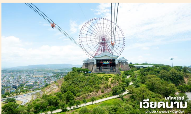
มหัศจรรย์ เวียดนาม ฮาลอง • ฮาลอง • นิงห์บิงห์