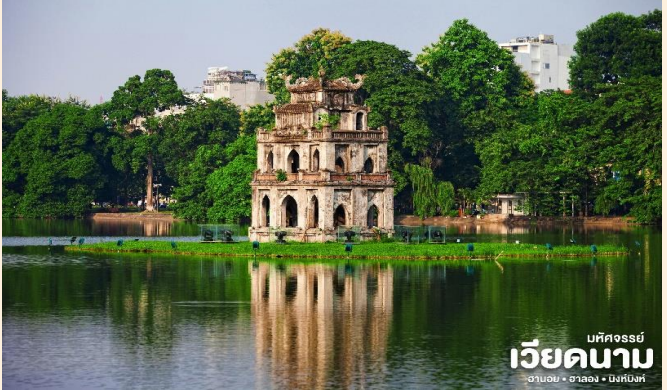
บห์จอร์รี่ เวียดนาม ฮานอย • ฮาลอง • บิ่งห์บิ่งห์

📍 นำท่านชมทะเลสาบคินดาบ ทะเลสาบใจกลางเมืองฮานอย ทะเลสาบแห่งนี้มีตำนานกล่าวว่า ในสมัยที่เวียดนามทำสงครามสู้รบกับประเทศจีน แต่ยังไม่สามารถเอาชนะทหารจากจีนได้สักที ทำให้เกิดความท้อแท้พระทัย เมื่อได้มาล่องเรือที่ทะเลสาบแห่งนี้ ได้มีเต่าขนาดใหญ่ตัวหนึ่งได้คาบดาบวิเศษมาให้พระองค์ เพื่อทำสงครามกับประเทศจีนหลังจากที่พระองค์ได้รับดาบมานั้น พระองค์ได้กลับไปทำสงครามอีกครั้ง และได้รับชัยชนะเหนือประเทศจีน ทำให้บ้านเมืองสงบสุข เมื่อเสร็จศึกสงครามแล้ว พระองค์ได้นำดาบมาคืน ณ ทะเลสาบแห่งนี้