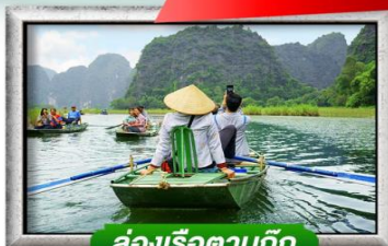
ล่องเรือตามก๊ก