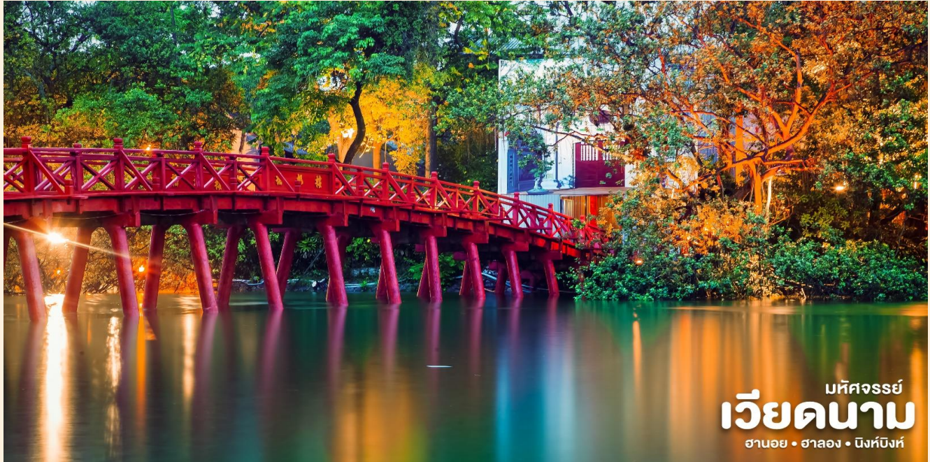
บห์จอร์รี่ เวียดนาม ฮานอย • ฮาลอง • บิ่งห์บิ่งห์

📍 จากนั้นนำท่านเข้าชม สะพานแสงอาทิตย์ สีแดงสดใสสู่กลางทะเลสาบคินดาบ ชม วัดหังจ็อกเชิน วัดโบราณ ภายในประกอบด้วย ศาลเจ้าโบราณ และ เต่าสตัฟ ขนาดใหญ่ ซึ่งมีความเชื่อว่า เต่าตัวนี้ คือเต่าศักดิ์สิทธิ์ 1 ใน 2 ตัวที่อาศัยอยู่ในทะเลสาบแห่งนี้มาเป็นเวลาช้านาน นำท่าน อิสระช้อปปิ้งถนน 36 สาย มีสินค้าราคาถูกให้ท่านได้เลือกสรรมากมาย กระเป๋า เสื้อผ้า รองเท้า ของที่ระลึกต่างๆ ฯลฯ