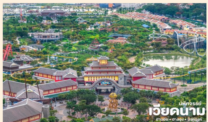
มหัศจรรย์ เวียดนาม ฮาลอง • ฮาลอง • นิงห์บิงห์

📍 นำท่านนั่งกระเช้าที่ใหญ่ที่สุดในโลก (Queen Cable Car) เป็นกระเช้าลอยฟ้า 2 ชั้นที่ใหญ่ที่สุดในโลกซึ่งจะนั่งกระเช้าข้ามทะเลไปตามระยะทาง 2,165 เมตร ทำให้เห็นวิวทิวทัศน์ที่สวยงามของเมืองฮาลองในมุมสูง เพื่อเดินทางไปยังสวนสนุก (Sun World Halong Complex) เป็นสวนสนุกที่รวมความบันเทิงอันทันสมัยบนภูเขา Ba Deo มีเครื่องเล่นมากมาย ภายในสวนสนุกยังมีสวนญี่ปุ่น พิพิธภัณฑ์หุ่นขี้ผึ้ง โรงละครหุ่นกระบอก โดยมีแลนด์