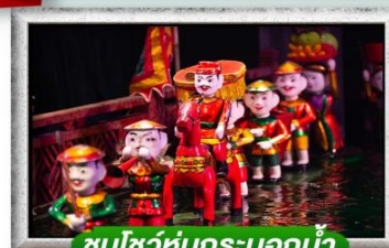
ชมโชว์หุ่นกระบอกน้ำ