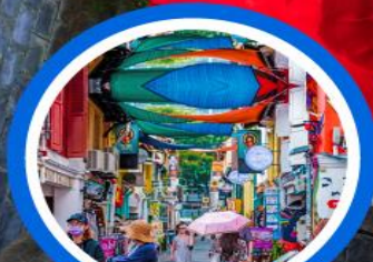
ตรอกฮาจิ