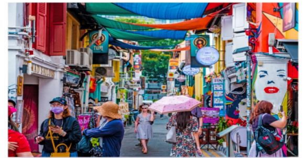
ตรอกฮาจิ