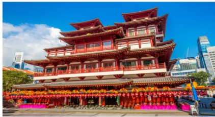
วัดพระเจ็ยงแก้ว