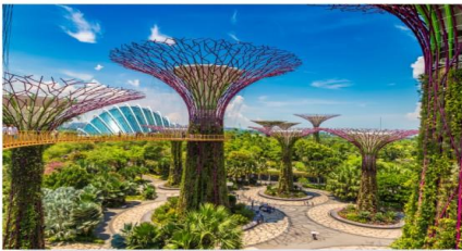
การ์เด้นบายเดอะเบย์