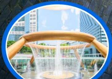
น้ำแห่งโชคกลาง