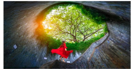
อุโมงค์ต้นไม้