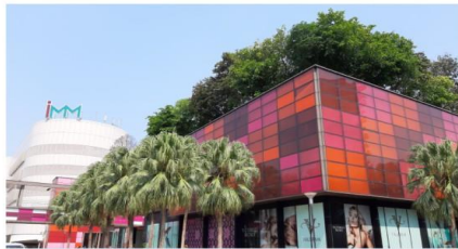
IMM เอากัเสีต