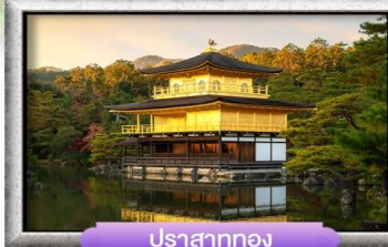
ปราสาททอง