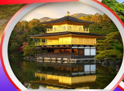
ปราสาททอง