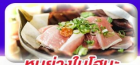
หอยย่างใบโอบะ