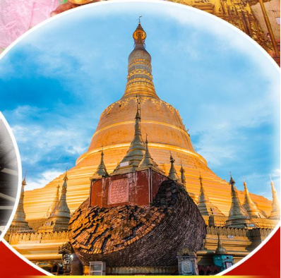
พระธาตุมุเตา

สักการะ 9 สิ่งศักดิ์สิทธิ์ ที่ต้องห้ามพลาด