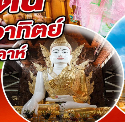
พระหงาทัดจี