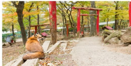
หมู่บ้านสุนัขจิ้งจอก