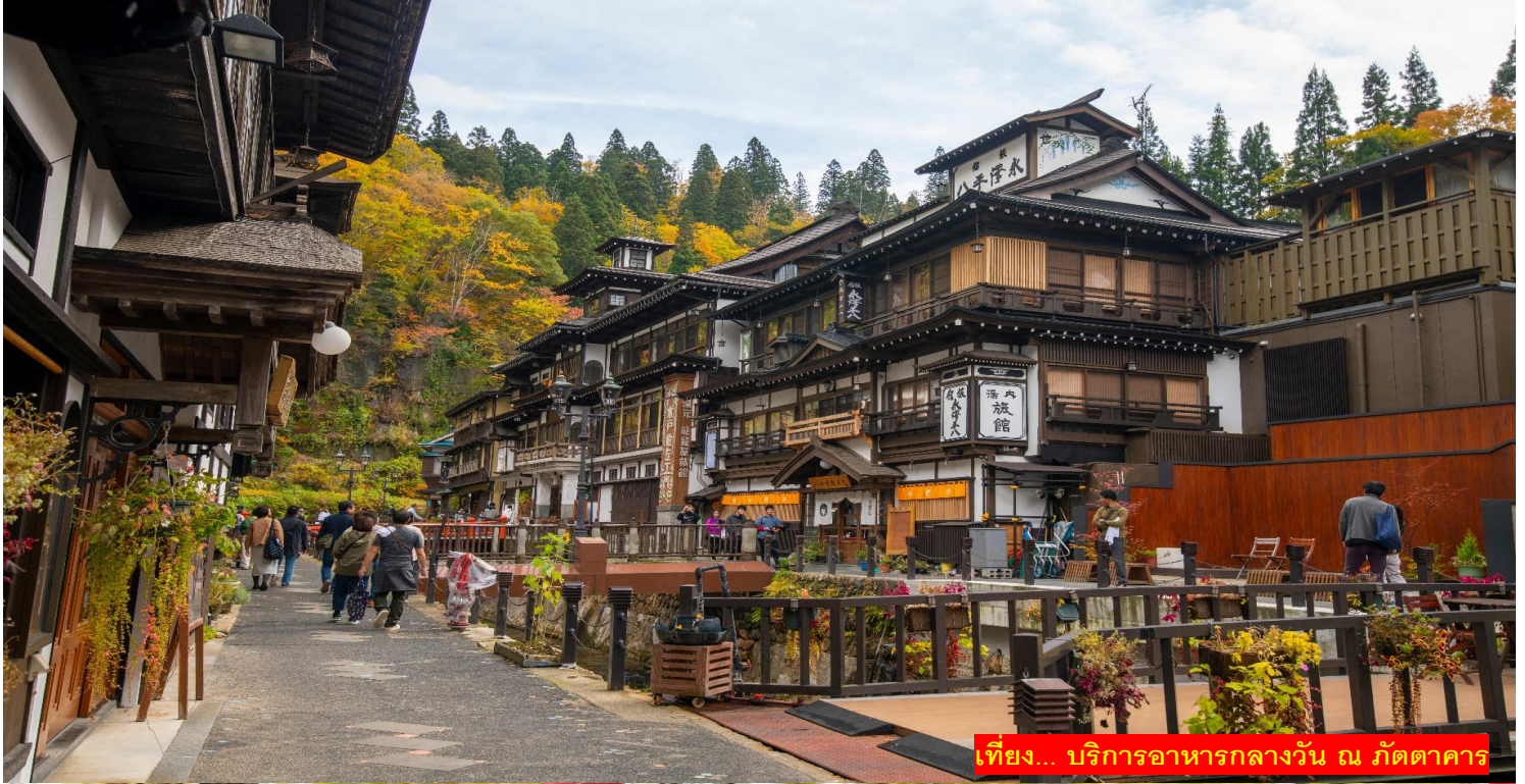
เที่ยง... บริการอาหารกลางวัน ณ ภัตตาคาร

(กินชั่นออนเซ็นมีคุณสมบัติเป็นออนเซ็นกำมะถันใสไม่มีสีและมีรสเค็มเล็กน้อย โดยว่ากันว่ามีส่วนช่วยรักษาบาดแผลโดนบาด, บาดแผลไฟไหม้, โรคผิวหนังเรื้อรัง, โรคเรื้อรังยอดฮิตของผู้หญิงและโรคหลอดเลือดแข็ง)