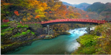
เมืองมรดกโลกนิกโกะ