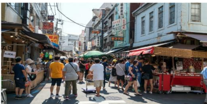
ตลาดปลาซึกิจิ