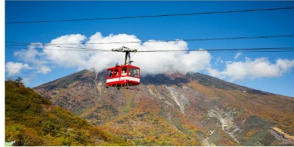
กระเช้าลอยฟ้าอะเคจิโตะระ