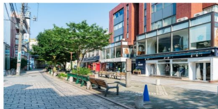
ย่านถนนหวานจิชูกาโอคะ