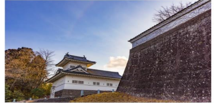
ปราสาทเซนได