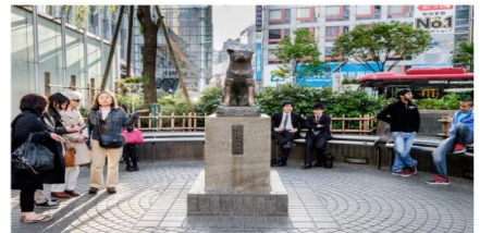
รูปปั้นสุนัขฮาจิโกะ