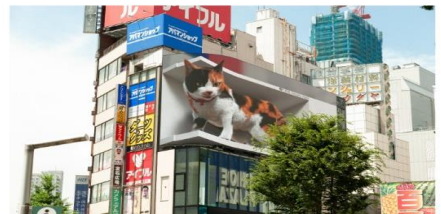
ซอปปิงชินจูกุ