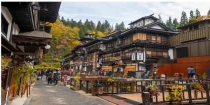
หมู่บ้านกินชอนออนเซ็น