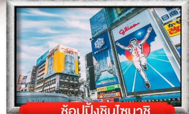
ช้อปปิ้งชินโซบาชิ

เมนู สุดพิเศษ !! บุฟเฟ่ต์ซาบู , ทยูย่างไบโอบะ