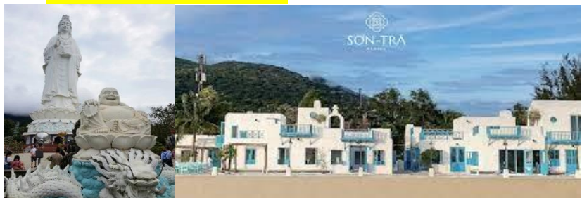
~ 5 ~

คาเฟ่ลับ ที่ SON TRA MARINA CAFE คาเฟ่ริมทะเลสุดปัง มุมถ่ายรูปสุดชิค สไตล์ Santorini Vibes มาก ๆ สวยจริงไม่จกตา (ไม่รวมค่าเครื่องดื่ม+อาหาร)