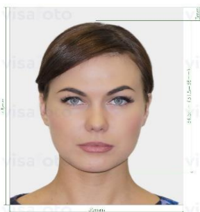
คุณสมบัติรูปถ่าย

2.รูปถ่ายสี ฉากหลังเป็นสีขาวเท่านั้น ขนาด กว้าง 3.5 ซม. สูง 4.5 ซม. จำนวน 3 รูป (ถ่ายไม่เกิน 6 เดือน) หน้าตรง ห้ามสวมแว่นตาหรือเครื่องประดับ ไม่ใส่คอนแทคเลนส์ ไม่ยิ้มเห็นฟัน ขึ้นอยู่กับประเทศที่จะเดินทาง ภาพถ่ายจะต้องครอบคลุมถึงศีรษะ และด้านบนของหัวไหล่ โดยต้องเห็นใบหน้าอย่างชัดเจน เห็นหน้าผากและใบหูชัดเจน