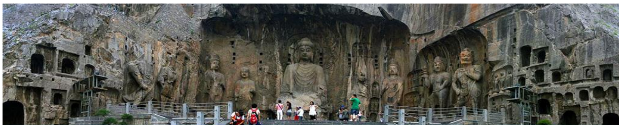
กำลังหลุมศพ