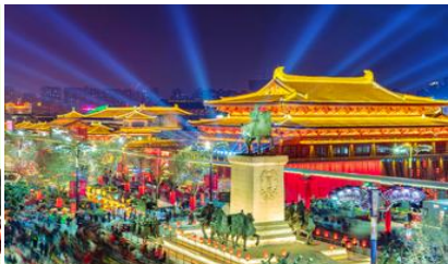
Nightless City of Great Tang