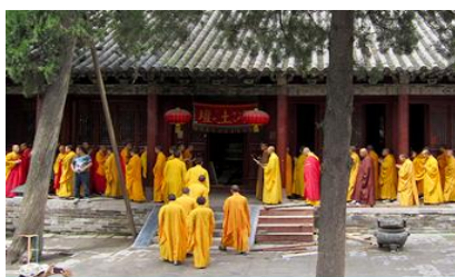
วัดเล่าหลิน