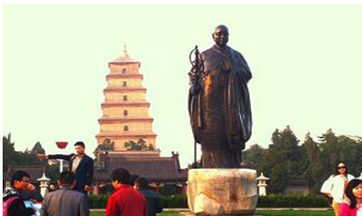
เจดีย์ห่านป่าใหญ่