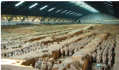
สุสานกบฏทหารม้าจีนซี

พักที่ โรงแรม HUASHAN KEZHAN หรือเทียบเท่าระดับเดียวกันเมืองหัวซาน