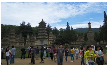
ป่าเจดีย์