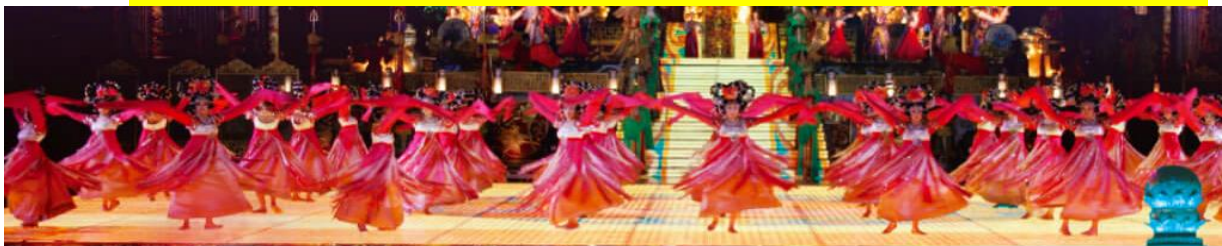
โชว์ราชวงศ์ถัง

ท่านสามารถเลือกซื้อโปรแกรมเสริม การแสดงโชว์ราชวงศ์ถัง อันตระการตา ชมการแสดงนาฏศิลป์ชุดต่างๆ ในสมัยราชวงศ์ถัง ที่สะท้อนให้เห็นถึงความเจริญรุ่งเรืองในประวัติศาสตร์จีน อัตราค่าเข้าชม 200 หยวน