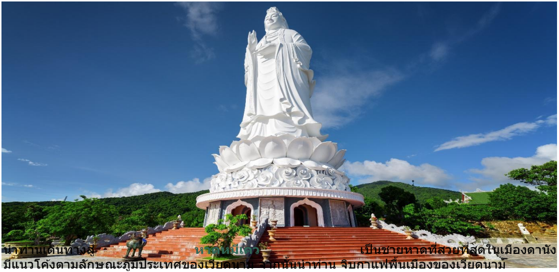
หน้าทางเดินทางสู่ พระนันทิ์ เป็นชายหาดที่สวยงามที่สุดในเมืองดานัง มีแนวโค้งตามลักษณะภูมิประเทศของเวียดนาม สักการะนันทิ์นันทาน จิบกาแฟพื้นเมืองของเวียดนาม

มีความเชื่อที่ว่าคอยปกป้องรักษาและคุ้มครองชาวประมงยามที่ออกไปหาปลานอกชายฝั่ง วัดแห่งนี้ยังเป็นสถานที่ศักดิ์สิทธิ์ที่มีคนให้ความเคารพและเข้ามาสักการะเป็นจำนวนมาก