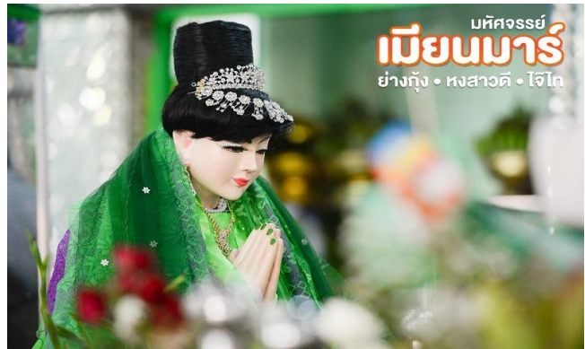
จากนั้น นำท่านชมและนมัสการ พระมหาเจดีย์ชเวดากอง(Shwedagon Pagoda)