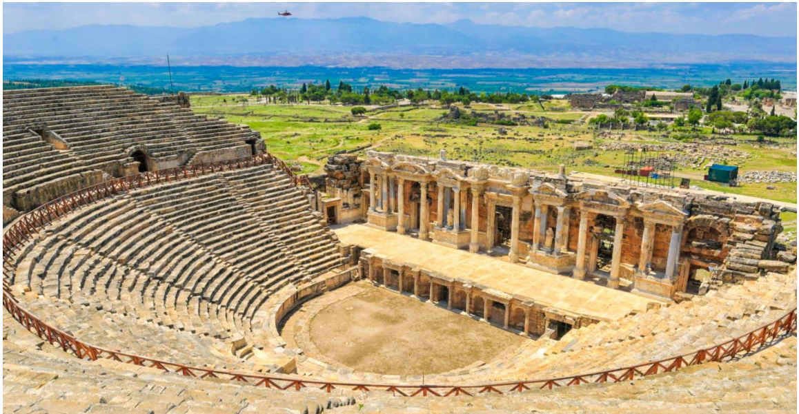
จากนั้นนำท่านชม ปราสาทปุยฝ้าย (Cotton Castle)