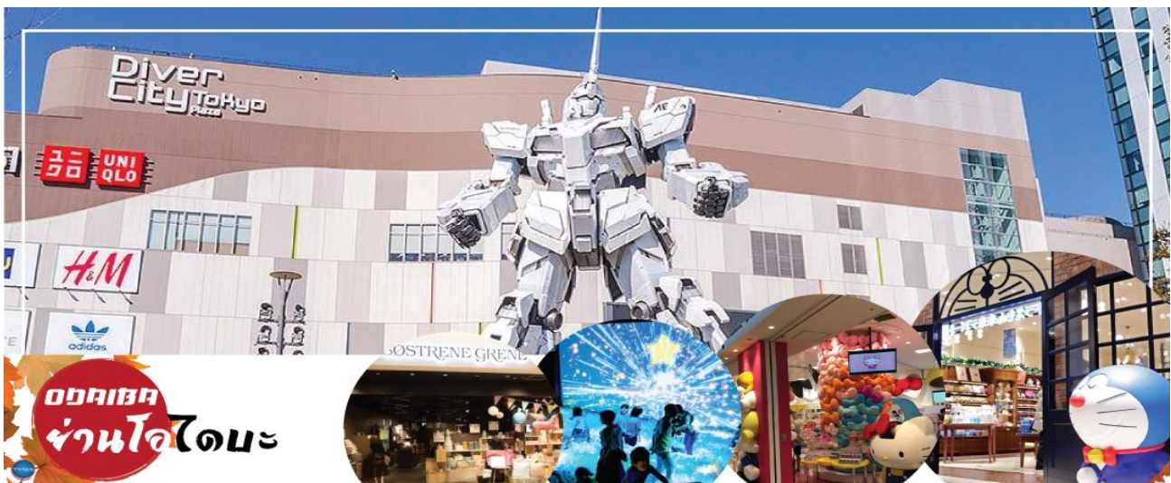
ออดิเบค ช้อปปิ้ง ย่านโอไดบะ