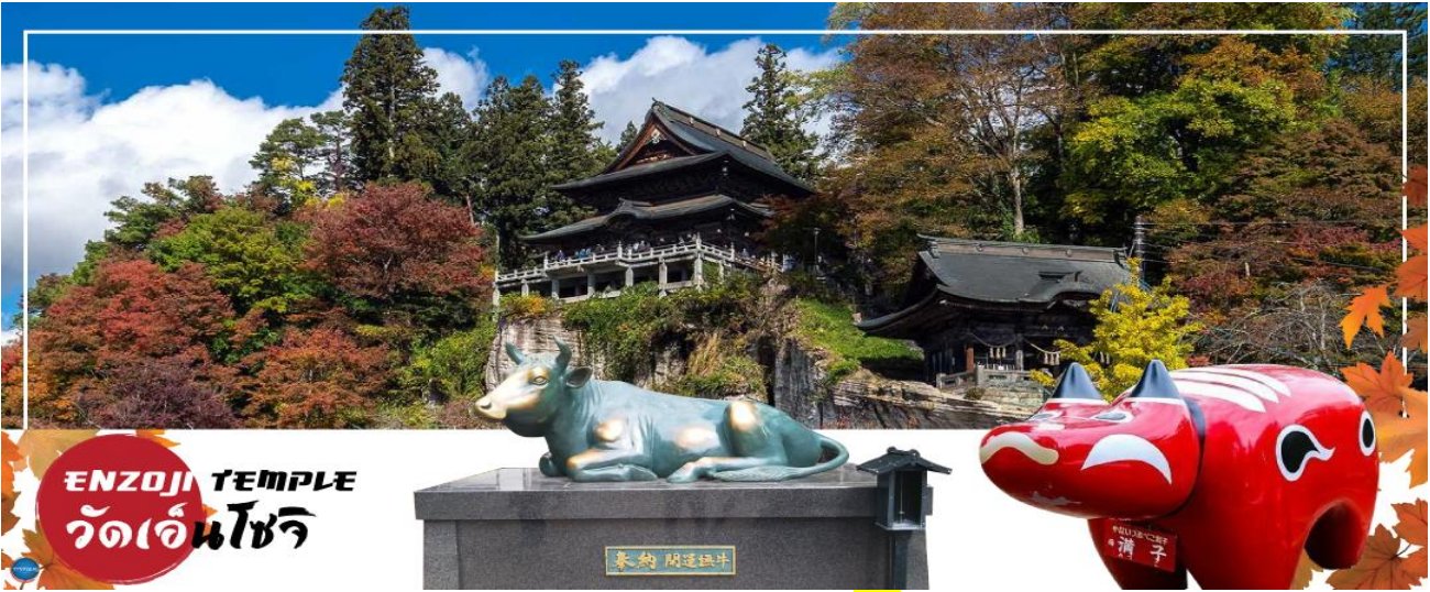
ENZOJI TEMPLE วัดเอ็นโซจิ

วันที่สอง วัดเอ็นโซจิ – เมืองไอสุ – ปราสาทสิรุกะ – สถานีรถไฟยูโนคามิ ออนเซ็น – หมู่บ้านโออุจิ จุค – หน้าผาล้านปี โทโนะเซทสึริ – เมืองฟุกุชิมะ