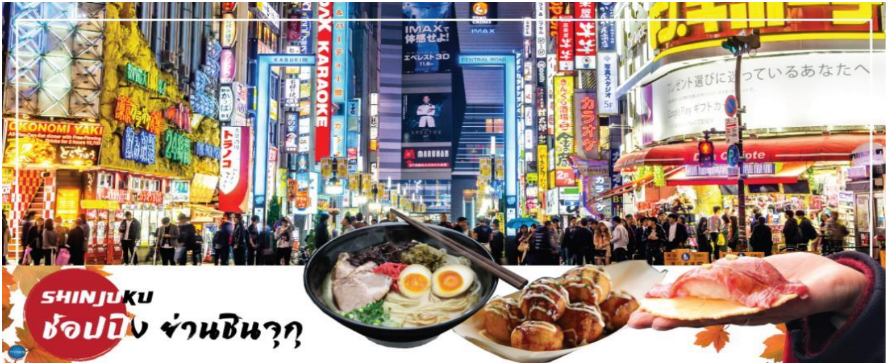
SHINJUKU ช้อปปิ้ง ย่านชินจุกุ

นำท่านช้อปปิ้ง ย่านชินจุกุ (Shinjuku) ให้ท่านอิสระและเพลิดเพลินกับการช้อปปิ้งสินค้ามากมาย ทั้งเครื่องใช้ไฟฟ้า กล้องถ่ายรูปดิจิตอล นาฬิกา เครื่องเล่นเกม หรือสินค้าที่จะเอาใจคุณผู้หญิงด้วย กระเป๋า รองเท้า เสื้อผ้า แบรินต์เนม เสื้อผ้าแฟชั่นสำหรับวัยรุ่น เครื่องสำอางยี่ห้อดังของญี่ปุ่นไม่ว่าจะเป็น KOSE, KANEBO, SK II, SHISEDO และอื่นๆ อีกมากมาย ห้ามพลาด!!! จุดเช็คอินแห่งใหม่ ของชาวโซเชียล นั่นก็คือ แมวยักษ์ 3 มิติ ที่โผล่บนจอแอลอีดีมีขนาดมหึมา จอมีความโค้งขนาด 154 ตารางเมตร (1,664 ตารางฟุต) เสียงที่ออกจากลำโพงคุณภาพเกรดดี ความละเอียดภาพระดับ 4K ถือเป็นเทคโนโลยีระดับสูง ที่ให้ภาพเสมือนจริงปรากฏเป็นภาพแมวเหมียวเดินเล่นไปมาอยู่เหนือกรุงโตเกียว นอกจากนี้แมวยักษ์แล้ว ท่านยังสามารถรับชมโฆษณาต่างๆ ที่ถูกครีเอทให้เป็นภาพ 3 มิติ ผ่านจอแอลอีดีนี้ ไม่ว่าจะเป็น แพนด้า, รองเท้าไนกี้, น้องหมา Pompompurin, จานบิน UFO แม้แต่หุ่นยนต์เครื่องดูดฝุ่น ท่านสามารถรับชมและเก็บภาพได้ตามอัธยาศัย