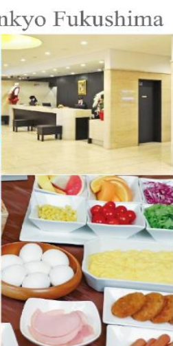
Hotel Sankyo Fukushima