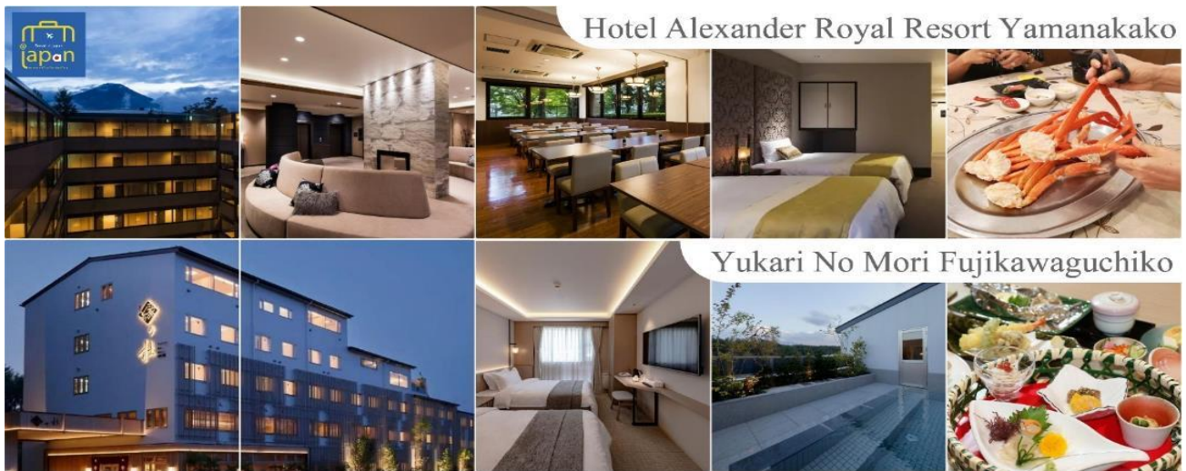
Hotel Alexander Royal Resort Yamanakako

รับประทานอาหารค่ำ ณ ภัตตาคาร ของโรงแรม (6) พิเศษ!! อิ่มอร่อยกับ บุฟเฟต์ซาบุ ホテル縁の杜河口湖 YUKARI NO MORI หรือระดับเดียวกัน หลังอาหารให้ท่านได้ผ่อนคลายกับการแช่น้ำแร่ธรรมชาติ เชื่อว่าถ้าได้แช่น้ำแร่แล้ว จะทำให้ผิวพรรณ สวยงามและช่วยให้ระบบหมุนเวียนโลหิตดีขึ้น