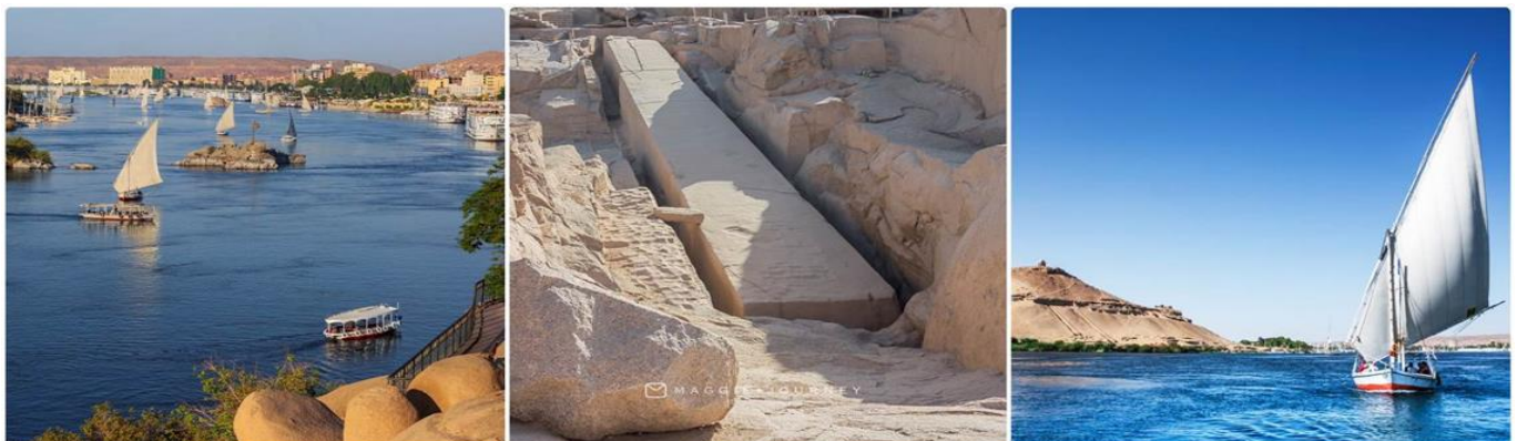
4 (ภาพใช้เพื่อการโฆษณาเท่านั้น)

เช้า ๑๐ บริการอาหารเช้า ณ ห้องอาหารของโรงแรม หลังอาหารเช้าคณะเดินทางไปสนามบินไคโรเพื่อเดินทางไปเมืองอัสวาน 00.00 น. ➔ ออกเดินทางโดยสายการบิน อีอีปต์ แอร์ เที่ยวบินที่ ..... 00.00 น. ถึงสนามบินเมืองอัสวาน