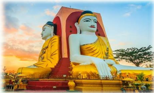
จากนั้นนำชม เจดีย์ไจ้ปุ่น หรือ พระ4ทิศ (Kyaik Pun Buddha) สร้างในปี 1476 มีพระพุทธรูปปางประทับนั่ง

นำท่านนมัสการ พระพุทธรูปไสยาสน์ชเวตาเลียย (Shew Thalyang Buddha) หรือ พระนอนชเวตาเลียย กราบนมัสการพระพุทธรูปนอนที่มีพุทธลักษณะที่สวยงามในแบบของมอญ ในปี พ.ศ.2524 ซึ่งเป็นที่เคารพนับถือของชาวพม่าทั่วประเทศและเป็นพระนอนที่งดงามที่สุดของพม่าองค์พระยาว 55 เมตร สูง 16 เมตรถึงแม้จะไม่ใหญ่เท่าพระพุทธรูปไสยาสน์เจ้าที่จัดที่ปางกึ่ง แต่ก็งามกว่าโดยพระบาทจะวางเหลื่อมพระบาท เป็นลักษณะที่ไม่เหมือนกับพระนอนของไทย แล้วให้ท่านอธิษฐานขอปิ้งสินค้าพื้นเมือง อาทิเช่น ไม้เกะสลัก, ผ้าถุง, ไส้กรอก ฯลฯ ตามอัธยาศัย