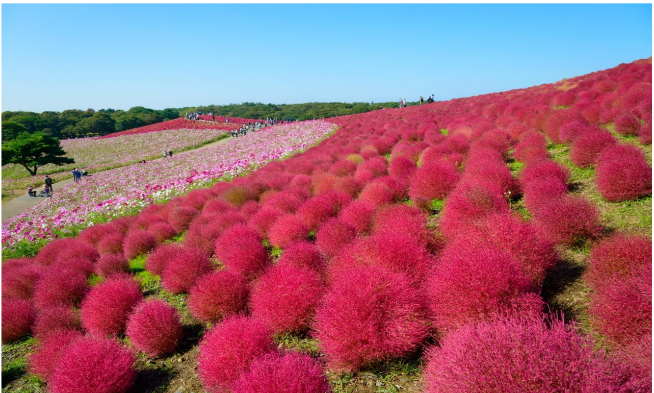
T2G-NRT09XJ Autumn Red Leave...Tokyo Fuji Nikko 6D4N (XJ)