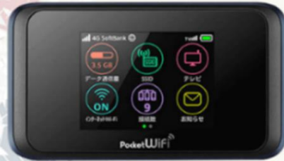
POCKET WIFI สำหรับนำไปใช้ที่ประเทศญี่ปุ่น