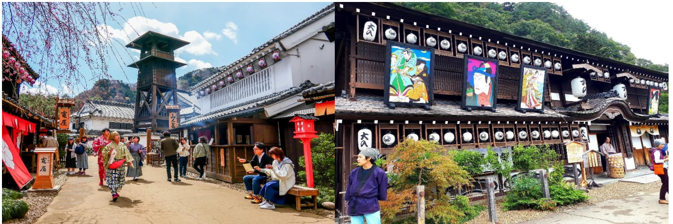
กลางวัน รับประทานอาหารกลางวัน ณ ร้านอาหาร (มื้อที่ 4)

หน้าผาหินโทโนะ เฮทสึริ หน้าผาหินที่ตั้งอยู่ติดกับแม่น้ำโอคาวะ โดยเชื่อกันว่า หน้าผาหินแห่งนี้มีอายุหลายล้านปี และถูกธรรมชาติกัดเซาะในระยะเวลาที่ผ่านมา ทำให้หน้าผาแห่งนี้มีรูปร่าง หน้าตาที่แปลกประหลาดคล้ายๆกับเจดีย์หินขนาดยักษ์ นับเป็นอีกหนึ่งจุดชมวิวที่ทุกท่านไม่ควรพลาด