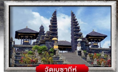
วัดเขษภักดิ์