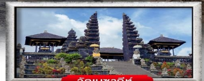
วัดเบซากีห์