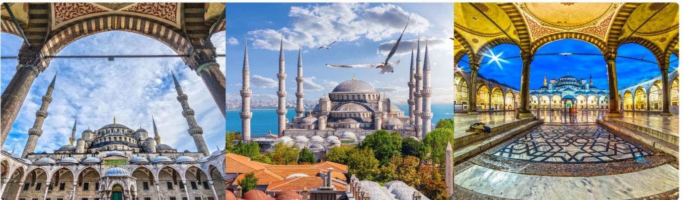
ซึ่งก็คือ Sultan Ahmed นั่นเอง

เช้า 🕒 บริการอาหารเช้า ณ ห้องอาหารของโรงแรม จากนั้นออกเดินทางสู่ กรุงอิสตันบูล เดิมชื่อ คอนสแตนติโนเปิล เป็นเมืองที่มีประชากรมากที่สุดในประเทศตุรกี ตั้งอยู่บริเวณช่องแคบบอสฟอรัส ซึ่งทำให้อิสตันบูลเป็นเมืองสำคัญเพียงเมืองเดียวในโลก ที่ตั้งอยู่ในทวีปคือ ทวีปยุโรป (ฝั่งบอสฟอรัส) และ ทวีปเอเชีย (ฝั่งอนาโตเลีย) จากนั้นนำทุกท่านชม สุเหร่าสีน้ำเงิน (BLUE MOSQUE) หรือ SULTAN AHMET MOSQUE ถือเป็นสุเหร่าที่มีสถาปัตยกรรมเป็นสุดยอดของ 2 จักรวรรดิ คือ ออตโตมันและไบเซนไทน์ เพราะได้รวบรวมเอาองค์ประกอบจากวิหารเซนต์โซเฟียผนวกกับสถาปัตยกรรมแบบอิสลามดั้งเดิม ถือว่าเป็นมัสยิดที่ใหญ่ที่สุดในตุรกี สามารถจุคนได้เรือนแสน ใช้เวลาในการก่อสร้างนานถึง 7 ปี ระหว่าง ค.ศ.1609-1616 โดยตั้งชื่อตามสุลต่านผู้สร้าง