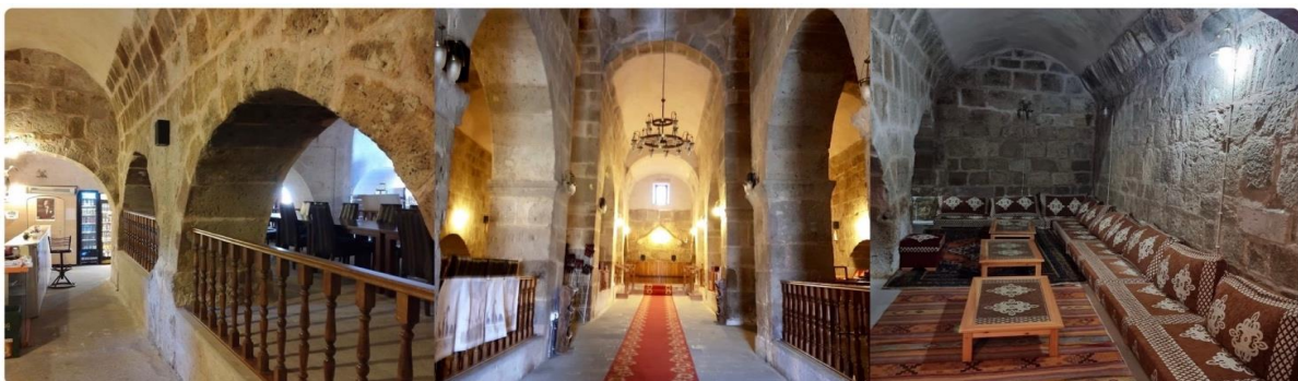
หน้า 7 (ภาพใช้เพื่อการโฆษณาเท่านั้น)

ใช้เวลาเดินทาง 8 ชม.(630 กม.) ระหว่างทางแวะถ่ายรูป CARAVANSARAI ที่พักร่มระหว่างทางของกองคาราวาที่เดินทางเส้นทางสายไหมของชาวเติร์กในสมัยออตโตมัน มีกำแพงล้อมรอบเพื่อป้องกันลมและฝนรวมทั้งพายุรุนแรงและการปล้นสดมภ์