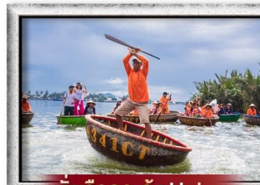
นั่งเรือกระดิง Hoi an