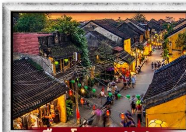
เมืองโบราณ Hoi an