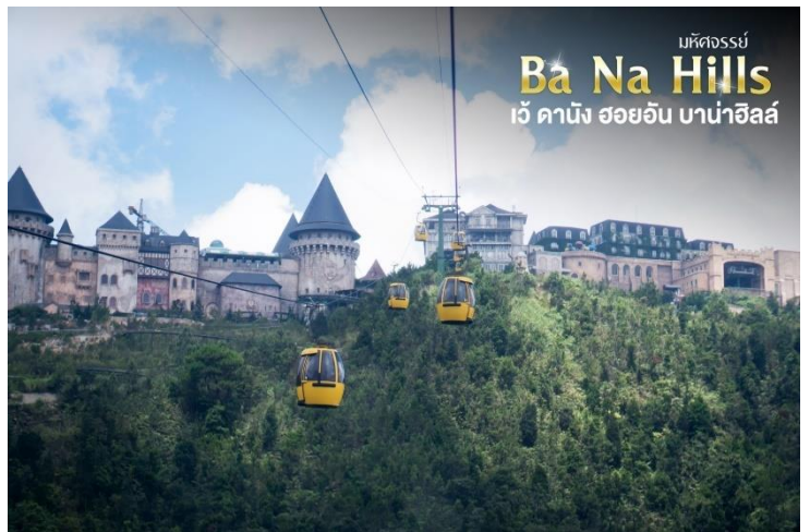
มหัศจรรย์ Ba Na Hills เว้ ดานัง ฮอยอัน บานาฮิลล์

กระเช้าแห่งบานาฮิลล์นี้ได้รับการบันทึกสถิติโลกโดยWorld Record ว่าเป็นกระเช้าไฟฟ้าที่ยาวที่สุดประเภท Non Stop โดยไม่หยุดแะมีความยาวทั้งสิ้น 5,042 เมตรและเป็นกระเช้าที่สูงที่สุดที่ 1,294 เมตรนักท่องเที่ยวจะได้สัมผัสสลุยเมฆหมอกและบางจุดมี