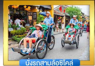
นั่งรถสามล้อซิโคล่

เดินทางโดยสายการบินแอร์เอเชีย 🍴 อาหาร : 10 มื้อ 🏨 โรงแรม : 4 ดาว