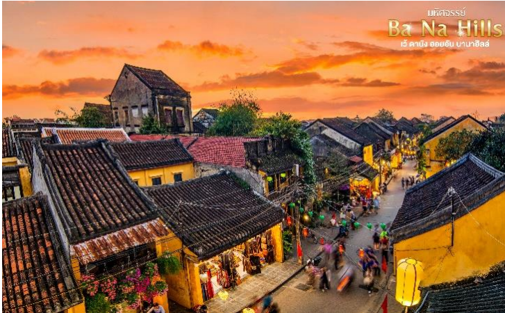
บริษัททัวร์โปร Ba Na Hills เวียดนาม ฮอยอัน บานาฮิลล์