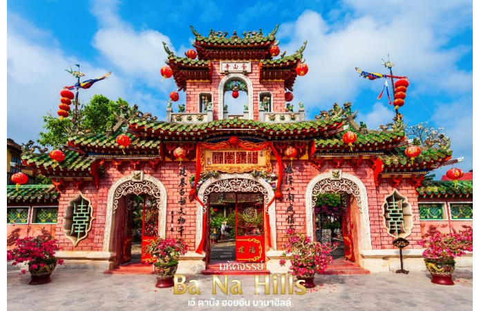
บริษัททัวร์โปร Ba Na Hills เวียดนาม ฮอยอัน บานาฮิลล์