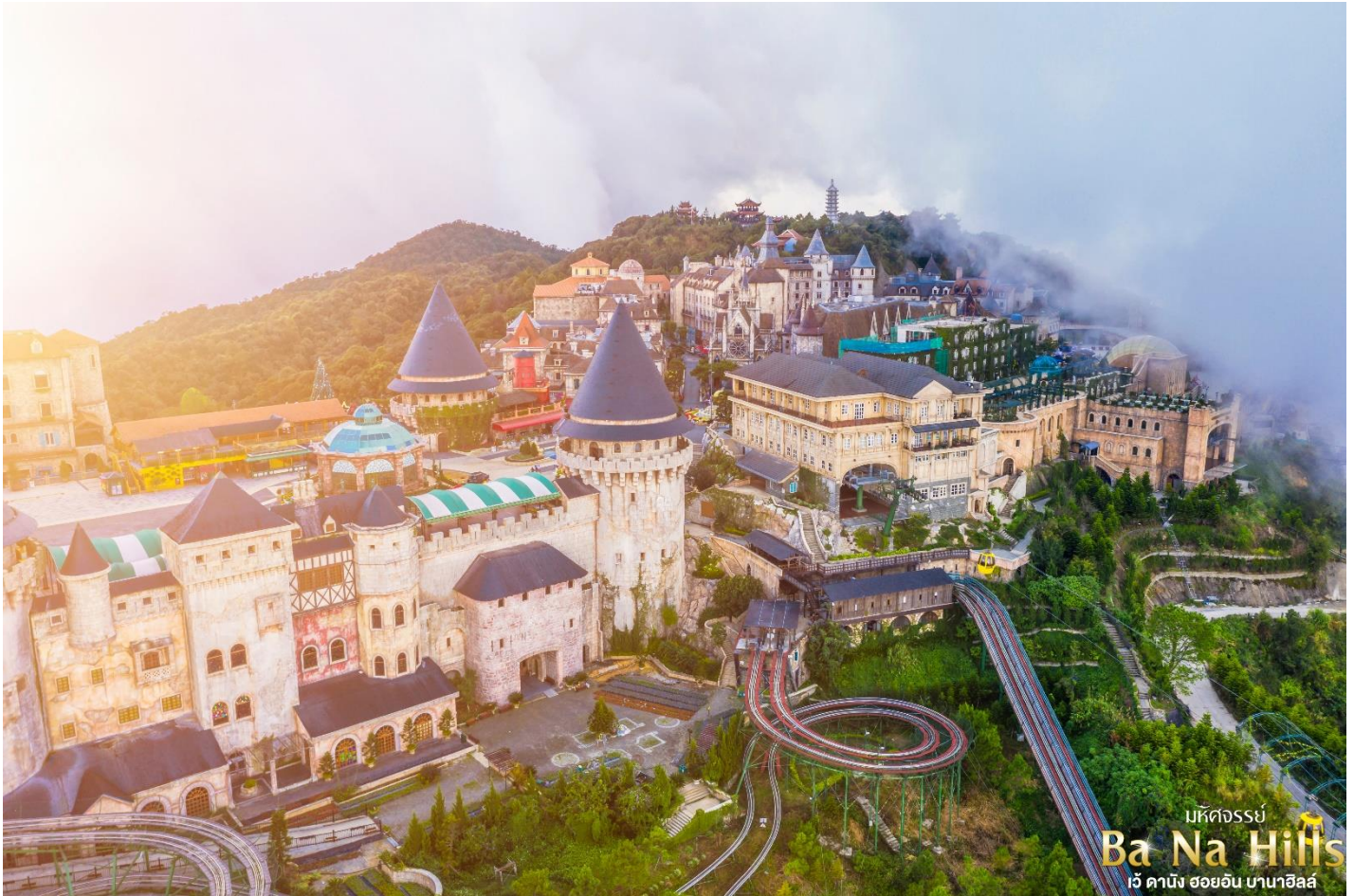
มหัศจรรย์ Ba Na Hills เว้ ดานัง ฮอยอัน บานาฮิลล์