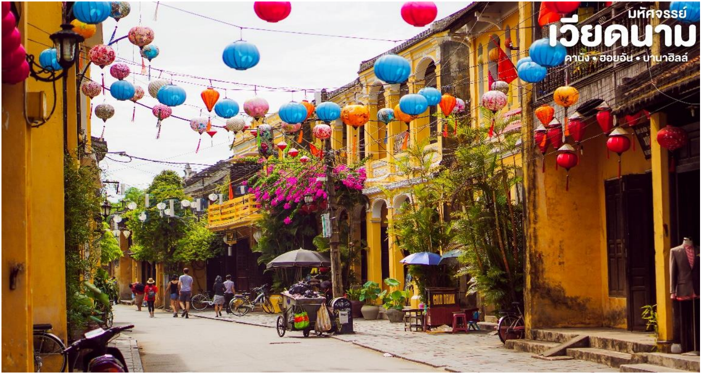
บริษัททัวร์โปร เวียดนาม คามิง • ฮอยอัน • บานาฮิลล์

นำชม Old House of Tan Skyบ้านโบราณ ซึ่งเป็นชื่อเจ้าของบ้านเดิมชาวเวียดนามที่มีฐานะดี ชมบ้านไม้ที่เก่าแก่และสวยงามที่สุดของเมืองฮอยอัน สร้างมากกว่า 200 ปี ปัจจุบันได้รับการอนุรักษ์ไว้เป็นอย่างดี การออกแบบตัวอาคารเป็นการผสมผสานระหว่างอิทธิพลทางสถาปัตยกรรมของจีน ญี่ปุ่น และเวียดนาม ด้านหน้าอาคารติดถนนเหวียนไทฮ็อกทำเป็นร้านบูติก ด้านหลังติดถนนอีกสายหนึ่งใกล้แม่น้ำทูโบนมีประตูออกไม้ สามารถชมวิวทิวทัศน์และเห็นเรือพายสัญจรไปมาในแม่น้ำทูโบนได้เป็นอย่างดี นำชม สะพานญี่ปุ่น ซึ่งสร้างโดยชุมชนชาวญี่ปุ่นเมื่อ 400 กว่าปีมาแล้ว กลางสะพานมีศาลเจ้าศักดิ์สิทธิ์ ที่สร้างขึ้นเพื่อสวดส่งวิญญาณมังกร ชม ศาลกวนอู ซึ่งอยู่บนสะพานญี่ปุ่นและที่ฮอยอันชาวบ้านจะนำสินค้าต่าง ๆ ไว้ที่หน้าบ้าน เพื่อขายให้แก่นักท่องเที่ยว ท่านสามารถซื้อของที่ระลึก เป็นของฝากกลับบ้านได้อีกด้วย เช่น กระเป๋าโคมไฟ เป็นต้น