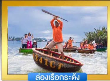
ล่องเรือกระดัง