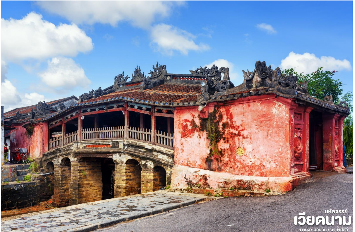
มหัศจรรย์ เวียดนาม คานิง • ฮอยอัน • บานาฮิลล์

เย็น ๗ บริการอาหารเย็น ณ ร้านอาหาร ที่พัก เข้าสู่ที่พัก MAGNOLIA 4* หรือเทียบเท่ามาตรฐานเวียดนาม (โรงแรมที่ระบุในรายการทัวร์เป็นเพียงโรงแรมที่นำเสนอเบื้องต้นเท่านั้น ซึ่งอาจมีการเปลี่ยนแปลงแต่โรงแรมที่เข้าพักจะเป็นโรงแรมระดับเทียบเท่ากัน)