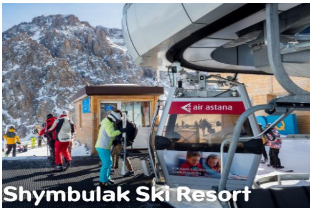
Shymbulak Ski Resort

นำท่านขึ้นกระเช้าสู่ ชิมบุลัก สกีรีสอร์ท สกีรีสอร์ทที่ใหญ่และทันสมัยของอัลมาตี แวดล้อมด้วยเทือกเขาสูงที่ปกคลุมด้วยหิมะขาวโพลนบนยอด ป่าสนอายุหลายร้อยปี และทะเลสาบในหุบเขา ซึ่งท่านสามารถชมทิวทัศน์ที่สวยงามของเมืองจากมุมสูงท่ามกลางสายลมหนาวอันสดชื่น จากสกีรีสอร์ทแห่งนี้พื้นที่ของรีสอร์ทประกอบด้วยลานสกีและเครื่องเล่นสำหรับกิจกรรมหิมะหลากหลายซึ่งท่านสามารถเลือกใช้บริการตามอัธยาศัย (ค่าอุปกรณ์และบริการของกิจกรรมต่างๆ ไม่ได้รวมอยู่ในค่าทัวร์)