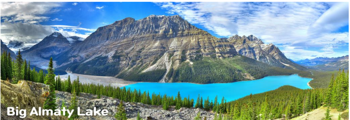
Big Almaty Lake