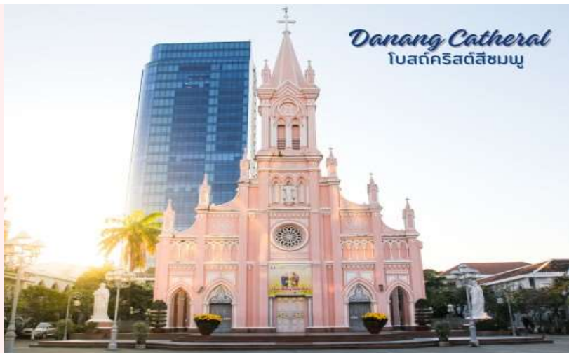
Danang Cathedral โบสถ์คริสต์สีชมพู

แวะร้านเยื่อไผ่ เป็นร้านขายผลิตภัณฑ์ที่ทำมาจากเยื่อไผ่ มีคุณสมบัติในการซับน้ำ ซักกลิ่น ได้เป็นอย่างดี โดยสินค้า น่าสนใจมีครีมย้อมผมธรรมชาติจากถ่านไผ่ ชุดชั้นในจากเยื่อไผ่ หมวกคลุมซับน้ำและแผ่นรัดบรรเทาอาการปวดเมื่อย เป็นต้น