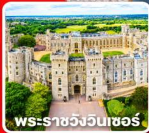
พระราชวังวินเซอร์

พักผ่อนนอน 4 คืนและ อิสระให้ท่านได้เที่ยวลอนดอนแบบเต็มอิ่ม 1 วัน