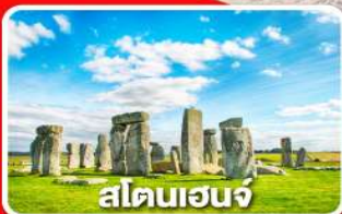
สโตนเฮนจ์