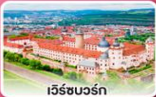
เว็ชบวร์ค