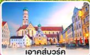
อาคส์บวร์ค