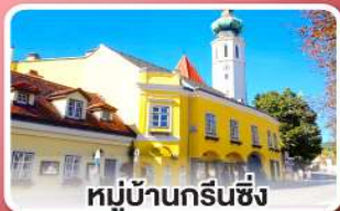
หมู่บ้านกรีนซิ่ง