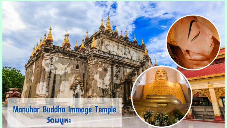
Manuhar Buddha Image Temple วัดมณฑะ

นำท่านสู่ วัดมณฑา (Manuha Temple) หรือ “ พระอิตอัถ ” เป็นวัดและโบราณสถาน ที่สร้างโดยพระเจ้ามณฑา กษัตริย์มอญแห่งอาณาจักรสุธรรมวดี ขณะที่พระองค์ทรงถูกจองจำในเมืองพุกามในรัชสมัยพระเจ้าอโนรธา มังช่อ ปัจจุบันตั้งอยู่ในเขตมณฑะเลย์ ประเทศพม่า ประวัติได้เล่าว่าพระเจ้าอโนรธา มังช่อ กษัตริย์พุกาม ได้ทรงทำสงครามกับอาณาจักรสุธรรมวดี เมืองหลวงของมอญและได้รับชัยชนะ จึง