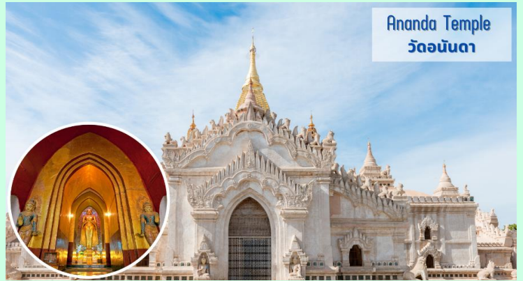
Ananda Temple วัดอนันดา

นำท่านชม วัดอนันดา (Ananda Temple) มหาวิหารขนาดใหญ่ที่ตั้งอยู่ในเมืองพุกาม เริ่มสร้างขึ้นในปี พ.ศ. 1633 แล้วเสร็จในปีต่อมา ในรัชกาลพระเจ้าจันซีต้า มีความสำคัญในฐานะได้รับการยกย่องว่าเป็น “เพชรน้ำเอกของพุทธศิลป์สกุลช่างพุกาม” เมื่อก่อนยอดพระเจดีย์ยังเป็นสีขาวเหมือนกับพระเจดีย์องค์อื่นๆ ของพุกาม แต่รัฐบาลพม่าได้มาทาสีทองทับเมื่อปี พ.ศ. 2533 เพื่อสมโภชการสร้าง