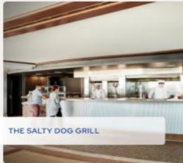
THE SALTY DOG GRILL