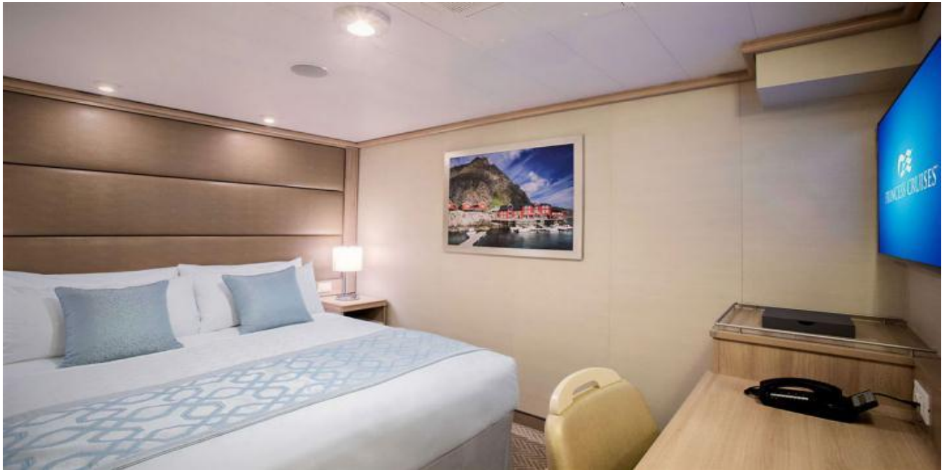
ห้องพักแบบ INSIDE ROOM