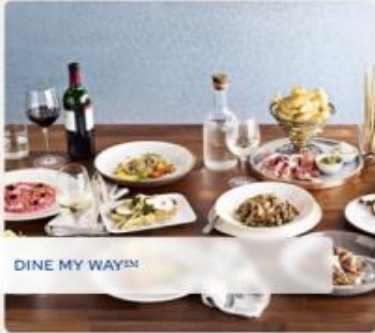
DINE MY WAY™