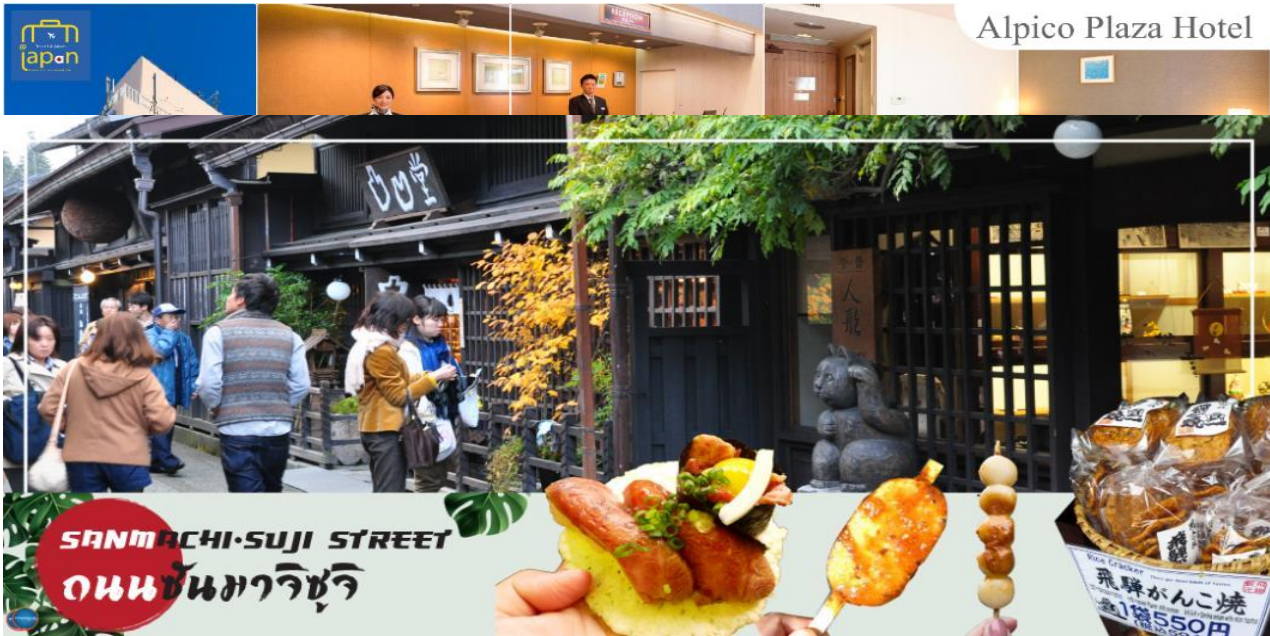
พักที่ ALPICO PLAZA HOTEL หรือเทียบเท่าระดับเดียวกัน

วันที่สี่ เมืองมัตสึโมโตะ - เมืองนากาโนะ - คามิโคจิ - สะพานกัปปะ - เมืองเซกิ - พิพิธภัณฑ์มิดซันชู - วัดโอสุคินนอน - ถนนช้อปปิ้งโอสุ