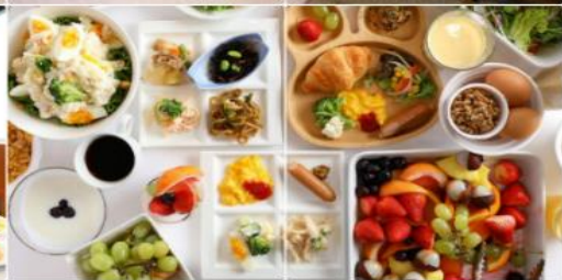
พักที่ HOTEL B SUITES NAMBA, OSAKA หรือเทียบเท่าระดับเดียวกัน

วันที่หก ทำอากาศยานนานาชาติคันไซ โอซาก้า ประเทศญี่ปุ่น – ทำอากาศยานสุวรรณภูมิ กรุงเทพฯ ประเทศไทย