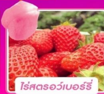
โรสตรอว์เบอร์รี่