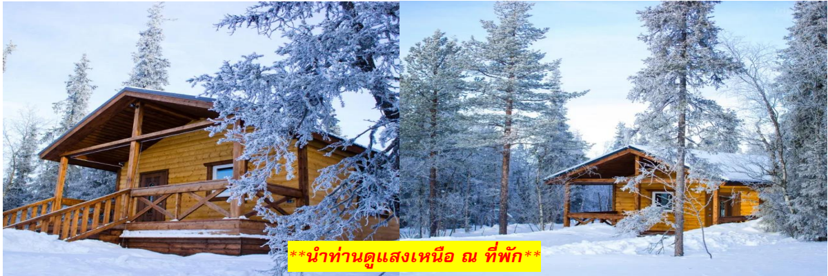
**นำท่านดูแสงเหนือ ณ ที่พัก**

นำท่านเข้าสู่ที่พัก LAPLANDIA VILLAGE MURMANSK แบบสไตล์ WOODEN COTTAGE หรือเทียบเท่า (คืนที่ 3)