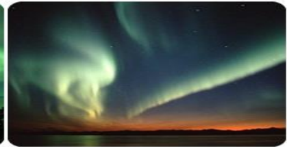
**นำท่านดูแสงเหนือ ณ ที่พัก**

*** การพบเห็นปรากฏการณ์แสงเหนือ เป็นปรากฏการณ์ทางธรรมชาติ ไม่สามารถกำหนดหรือทราบล่วงหน้าได้ โอกาสที่จะได้เห็นขึ้นอยู่กับสภาพอากาศเป็นสำคัญ โดยช่วงปลายฤดูใบไม้ร่วงจนถึงต้นฤดูใบไม้ผลิ ในเดือน ตุลาคม กุมภาพันธ์ และ มีนาคม เป็นเดือนที่เหมาะสมสำหรับการชมออโรราทางซีกโลกเหนือ มักจะเกิดในช่วงเวลาที่มืดจนถึงเที่ยงคืน และ โปรแกรมอาจมีการปรับเปลี่ยนได้ตามความเหมาะสม***