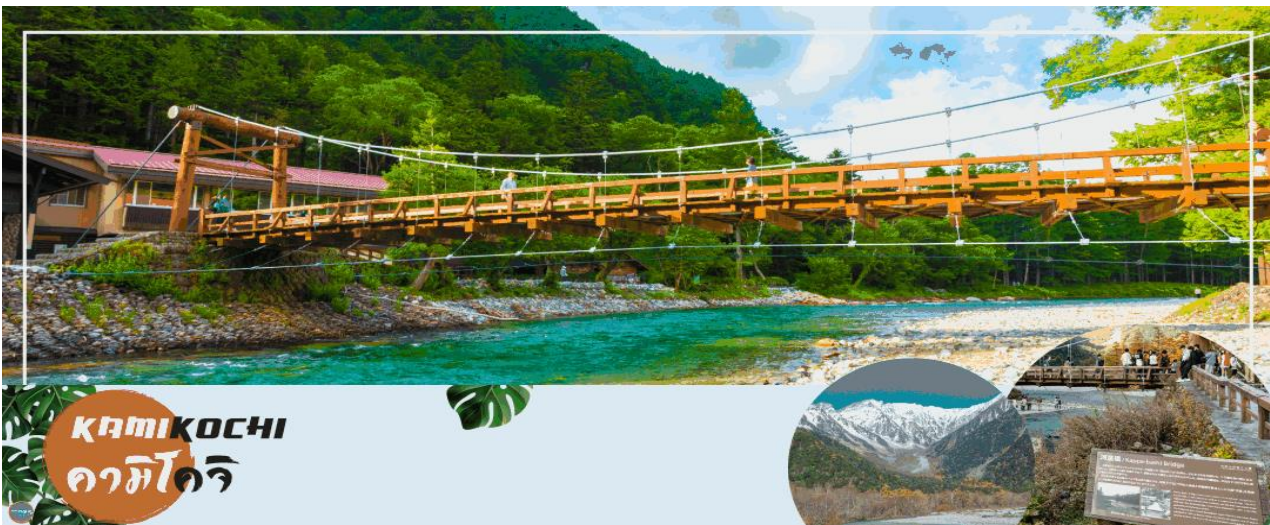
KAMIKOCHI คามิโคจิ

เมืองมัตสึโมโตะ - เมืองนากาโน่ - คามิโคจิ - สะพานคัปปะ - เมืองยามานาชิ - สวนดอกไม้ฮานะโนะมียาโกะ หรือ เทศกาลชมดอกลาเวนเดอร์ที่ทะเลสาบคาวากูจิ (ตามฤดูกาล) - หมู่บ้านโอชิโนะฮักไก - ออนเซ็น + ชาบูยักษ์