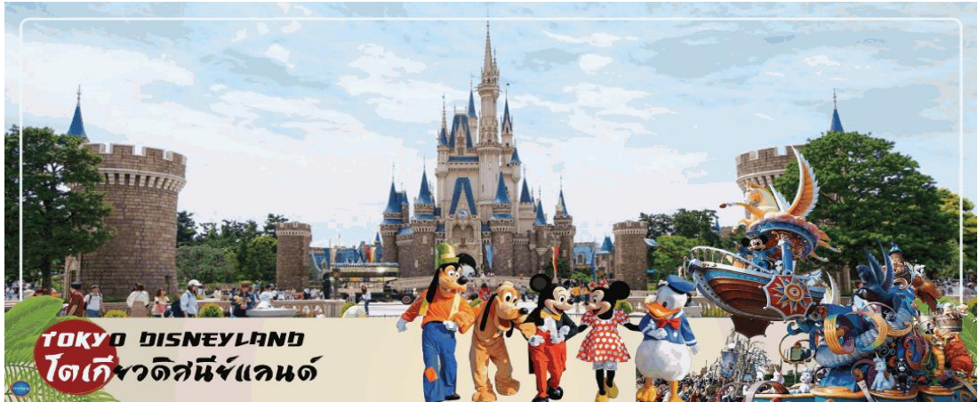
TOKYO DISNEYLAND โตเกียวดิสนีย์แลนด์