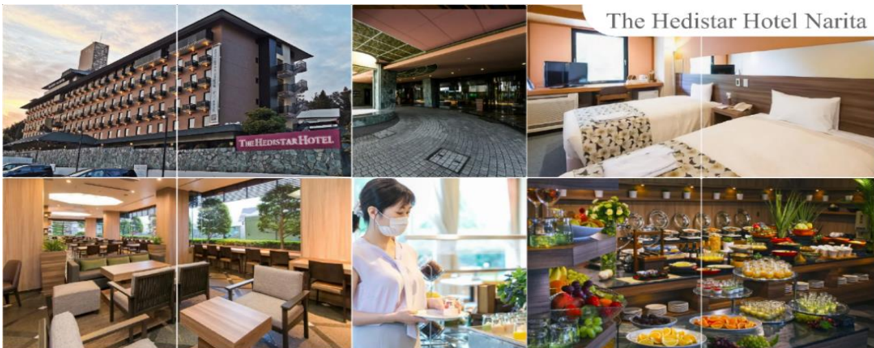
พักที่ THE HEDISTAR HOTEL NARITA หรือระดับเดียวกัน