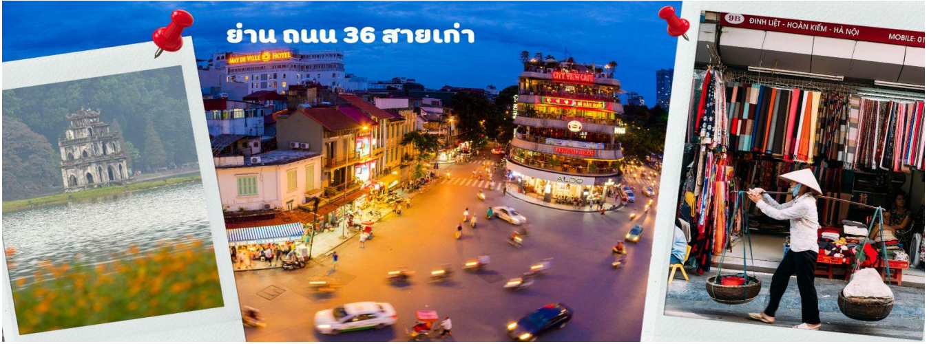
ย่าน ถนน 36 สายเก่า

หัตถกรรมสอดคล้องกับชื่อถนนแต่บะเส้น ในอดีตอย่าง เครื่องเงิน ผ้าไหม บนถนนแห่งนี้ แต่ปัจจุบันมากกว่า 36 ไปแล้ว ที่นี่จะเป็นแหล่ง Shopping มีสินค้าเกือบทุกชนิด ร้านขายชุดกีฬาทุกแบรนด์ เพราะที่นี่เป็นแหล่งผลิตให้หลาย ๆ แบรนด์