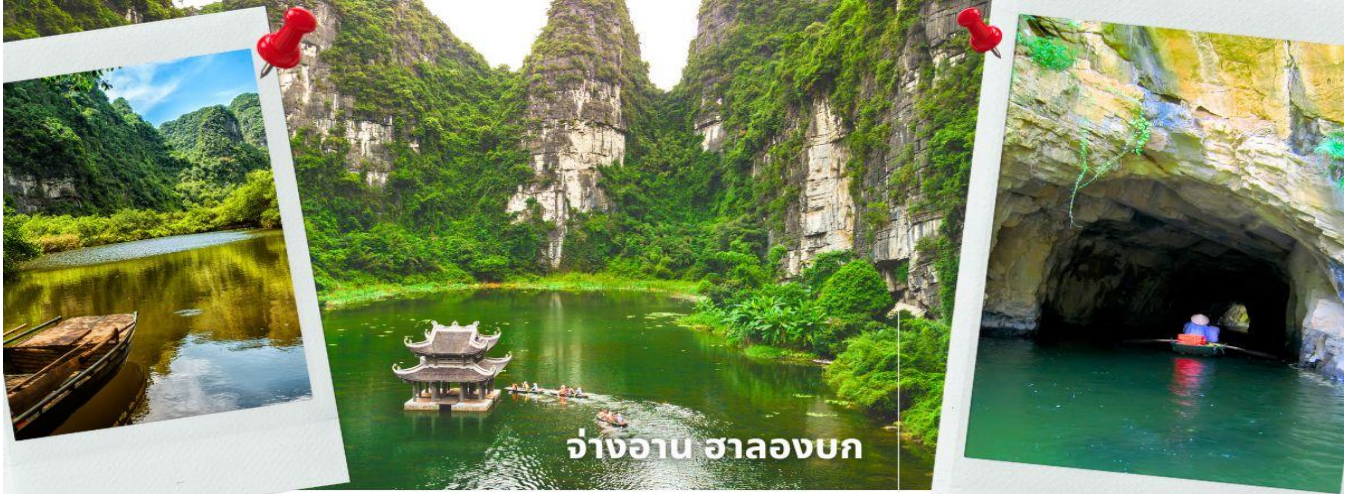
จางอาน ฮาลองบก

จากนั้นนำท่านเดินทางสู่ จางอาน เป็นพื้นที่ที่มีทั้งภูมิทัศน์อันงดงามของยอดเขาหินปูน แม่น้ำหลายสายไหลลดเลาะ บางส่วนจมอยู่ใต้น้ำ และยังถูกล้อมรอบด้วยผาสูงชัน จึงทำให้สถานที่แห่งนี้น่าชม การชื่นชมทัศนียภาพที่สวยงามในจางอานนั้น คือการล่องเรือเล็กประมาณลำละ 4-5 คนเพื่อเข้าไปเยี่ยมชมจางอาน เรือแจวก็จะพาเราไปเยี่ยมชมวัด หลังจากนั้นก็จะพาเราไปลอดถ้ำ มีทั้งหมด 49 ถ้ำ ซึ่งแต่ละถ้ำจะมีชื่อแตกต่างกันไปจะใช้เวลาล่องเรือไปกลับร่วมสองชั่วโมงเลย ที่เดียว จางอานยังถูกเรียกว่า ฮาลองบก เพราะที่นี่มีเขาหินปูนและถ้ำคล้ายกับที่อ่าวฮาลอง