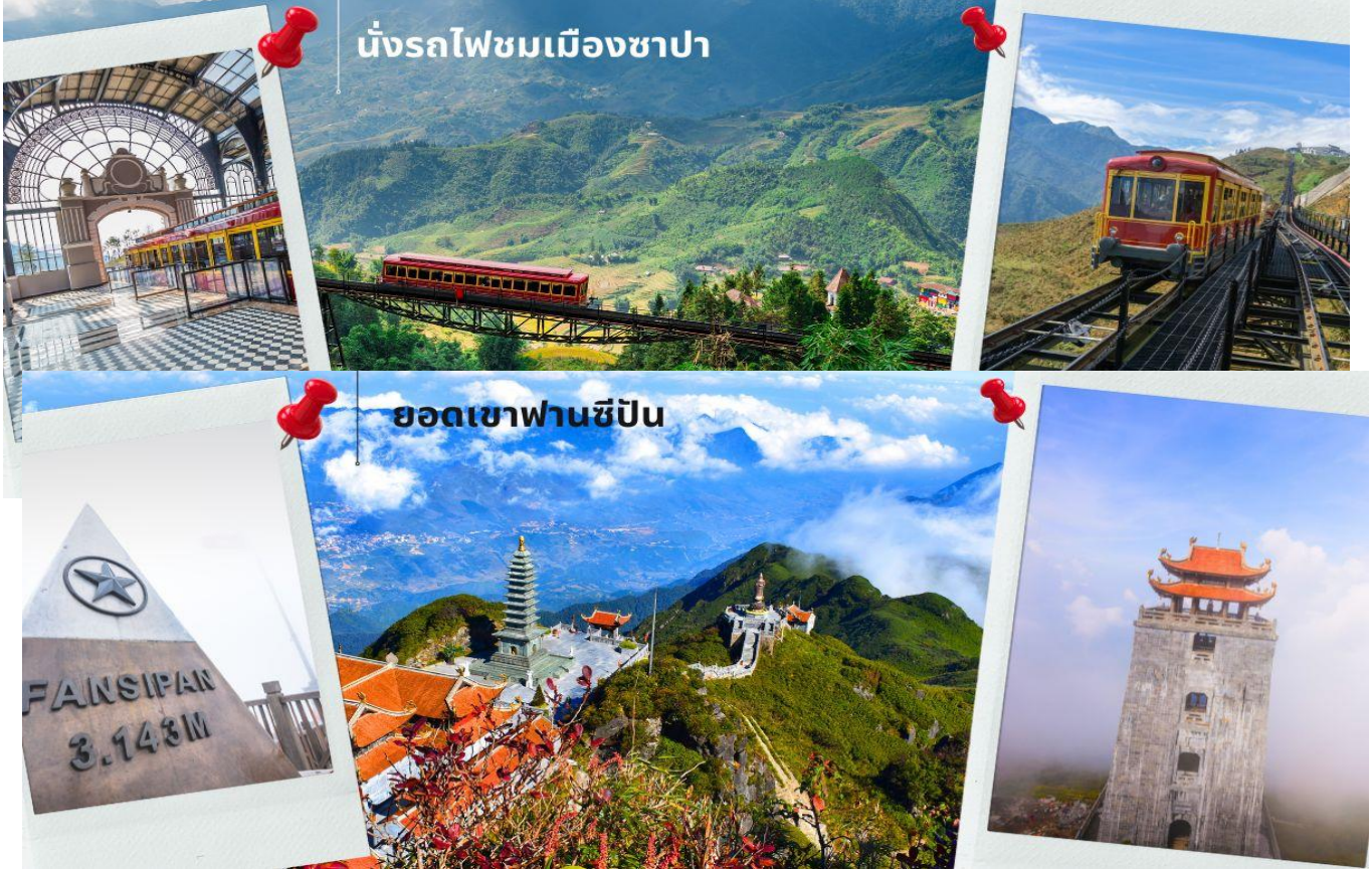
นั่งรถไฟชมเมืองซาปา

นำท่าน นั่งรถไฟชมเมืองซาปา (รวมค่ารถไฟชมเมือง) ท่านจะได้พบกับวิวทิวทัศน์ของเมืองซาปาที่เต็มไปด้วยความสดชื่น และสุดกลิ่นอายธรรมชาติ และยังตื่นตาไปด้วยวิวกุเอา และนาขั้นบันได ที่มีชื่อเสียงของเมืองซาปาอีกด้วย ความยาวประมาณ 2 กิโลเมตร โดยใช้เวลาประมาณ 20 นาทีเพื่อไปสู่สถานีขึ้นกระเช้า ที่จะนำท่านขึ้นสู่ยอดเขาฟานซีปัน