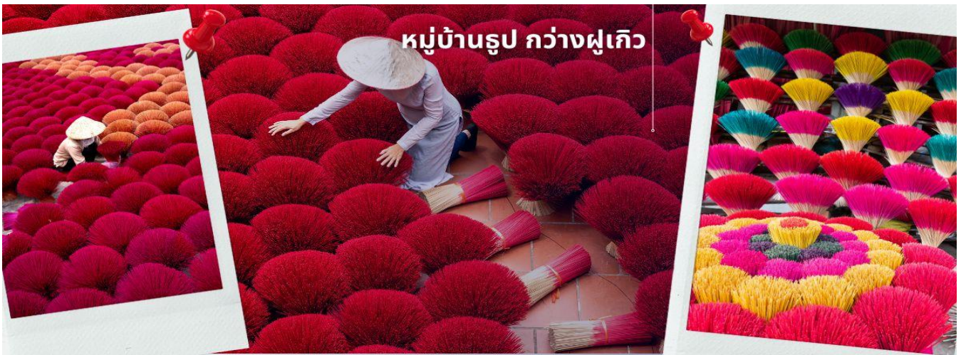
หมู่บ้านรูป กว้างฝูเกิว

จากนั้นนำท่านเดินทางสู่เมืองนิงห์บิงก์ และเที่ยวชมวิถีของชาวเวียดนามใน หมู่บ้านรูป หมู่บ้านชุมชนที่เป็นแหล่งผลิตรูปที่ใหญ่ที่สุดแห่งหนึ่งของประเทศเวียดนาม หมู่บ้านกว้างฝูเกิว หมู่บ้านรูป