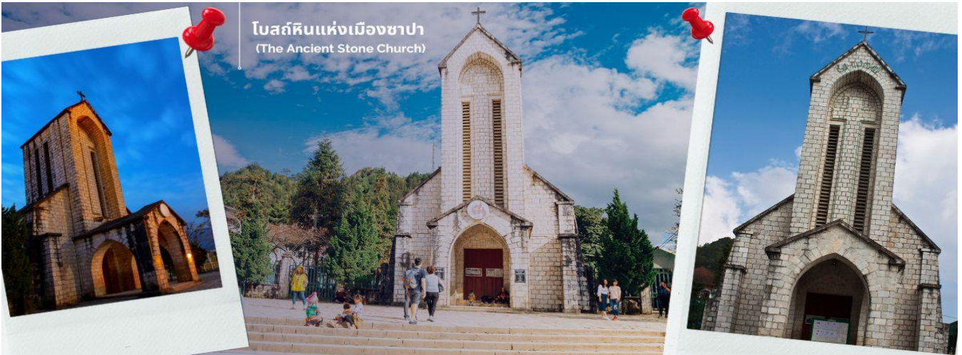
โบสถ์หินแห่งเมืองซาปา (The Ancient Stone Church)

นำท่านช้อปปิ้งที่ ตลาดไนต์เมืองซาปา มีสินค้าให้ท่านเลือกช้อปปิ้งมากมาย ไม่ว่าจะเป็นสินค้าพื้นเมือง ของฝาก ขนม กระจเป่า รองเท้า ท่านสามารถช้อปปิ้งได้อย่างจุใจ