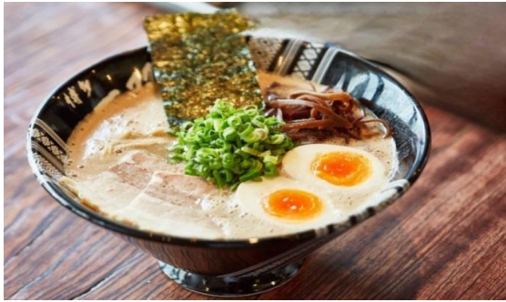
ซากาตะราเมง (Hakata Ramen)