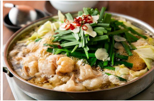
มตสึนาเบะ (Motsunabe)