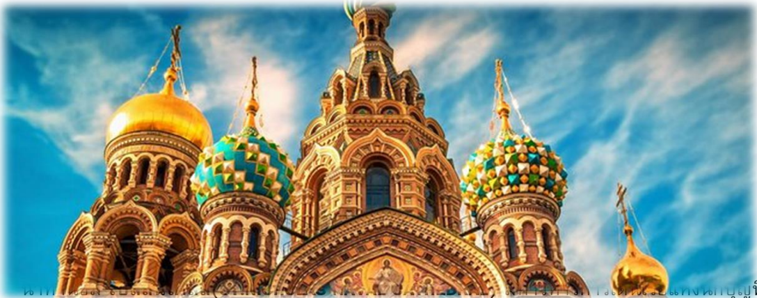
โบสถ์นิโคลัสมีหนังสือเงินที่งดงามและตั้งอยู่ริมฝั่งคลองครุย์คอฟมหาวิหารแห่งนี้ตั้งชื่อตามนักบุญนิโคลัส