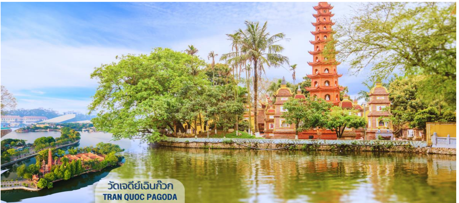
วัดเจดีย์เจินก๊วก TRAN QUOC PAGODA

จากนั้นนำท่านชม วัดเจินก๊วก (TRAN QUOC PAGODA) เป็นวัดที่อยู่ใจกลางเมืองของเวียดนาม ใกล้ชิดกับ ทะเลสาบตะวันตก ของเมืองฮานอย สร้างด้วยสถาปัตยกรรมจีนโบราณ มีความร่มรื่น และบรรยากาศดี จึงเป็นที่นิยมของนักท่องเที่ยวทั้งที่ชื่นชมความงามและมีศรัทธาในพระพุทธศาสนา เป็นเจดีย์ที่สำคัญและเก่าแก่ของ ชาวเวียดนาม สร้างขึ้นตั้งแต่ศตวรรษที่ 6 แต่เดิมใช้ชื่อ KHAI QUOC และได้มาเปลี่ยนเป็น TRAN QUOC ใน ศตวรรษที่ 14 โดยจักรพรรดิ LE HUY TONG การสร้างเจดีย์แห่งนี้ ใช้ศิลปะที่มีการผสมผสานกันอย่างลงตัว ระหว่างสถาปัตยกรรมจีนและเวียดนาม มีความสูง 15 เมตร มีทั้งหมด 11 ชั้น แต่ละชั้นจะมีลักษณะเหมือนกัน จากชั้นล่างถึงชั้นบน ต่างเพียงจะมีขนาดเล็กลงตามความสูง ที่ช่องหน้าต่างของแต่ละชั้นจะเป็นที่ประดิษฐาน ของประติมากรรมพระพุทธรูป อมิตาภพุทธเจ้า ตามความเชื่อของพุทธมหายาน ซึ่งมองเห็นเด่นชัดจาก ภายนอก ไล่เรียงขึ้นไปตรงกัน ตัวเจดีย์ก่อสร้างด้วยอิฐสีแดง ไขว้ให้เห็นการซ้อนของอิฐ ชั้นล่างด้านหน้าจะมี แท่นสำหรับให้นักท่องเที่ยวบูชา ภายในมีจารึกประวัติความเป็นมาทั้งของเจดีย์และพระศรีศากยมุนีปาง ปรีนิพพานที่ทำด้วยทองคำ