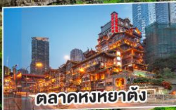
ตลาดหงหยาดัง