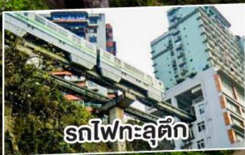
รถไฟทะลุคิ๊ง