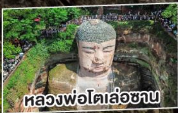
ถ่องฟ้อโตเล่อซาน