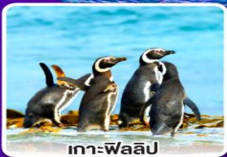
เกาะฟิลลิป

ทุกสิ่งทุกอย่างท่านละ 1 ตัว พร้อมไวน์ชั้นเยี่ยม