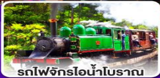
รถไฟจักรไอน้ำโบราณ