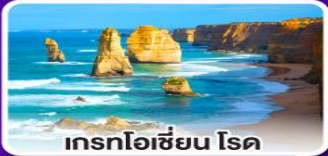
เกรทโอเซียน โรด