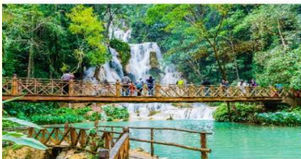
น้ำตกตาดขวางสี