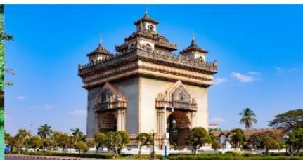
ประตูลอย